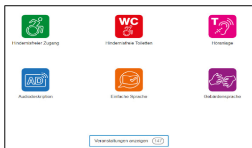
Figure 2 : pictogrammes (ici de ZH)

Avenir-inclusif.ch permet à tous les partenaires de saisir eux-mêmes les activités, de les organiser, de les promouvoir (calendrier, éventuellement newsletter) et de les illustrer (photos, brèves descriptions). La plateforme permet de faire connaître la diversité des projets à l'extérieur (travail de relations publiques, revue de presse, intégration des réseaux sociaux) et de transformer les Journées nationales d'action pour les droits des personnes handicapées en une campagne à l'échelle nationale.