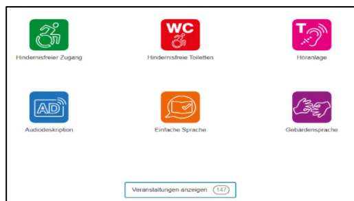
Abbildung 2: Piktogramme; hier Auszug aus ZH

Zukunft Inklusion ist viersprachig: Deutsch, Französisch, Italienisch und Romanisch. Die Kantone